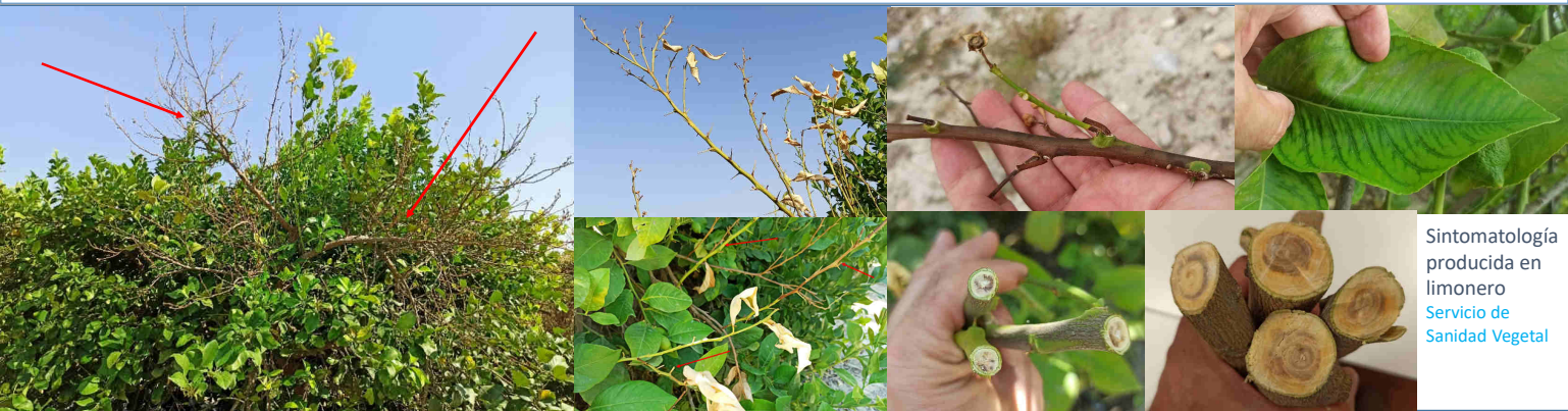
Sintomatología producida en limonero Servicio de Sanidad Vegetal

La enfermedad del mal seco es producida por el hongo Plenodomus tracheiphilus [= Phoma tracheiphila ]. Éste ha causado enormes pérdidas en plantaciones de limonero de varios países del Mediterráneo y zonas cercanas. En 2015, se detectó por primera vez en España (Málaga) sobre limonero (especie más sensible). En la Región de Murcia (Abanilla), en junio de 2020, se identificó el primer caso de la enfermedad en esta misma especie. En este primer foco, se encontraron numerosos ejemplares infectados en dos explotaciones vecinas. Más tarde, se encontraron nuevos casos en la misma zona, en Blanca y La Matanza (Murcia). Debido a la gravedad y riesgo de expansión, esta Consejería publicó la Orden 9 de marzo de 2021, donde se declaraba la existencia de la enfermedad y se dictan medidas fitosanitarias obligatorias para combatirla