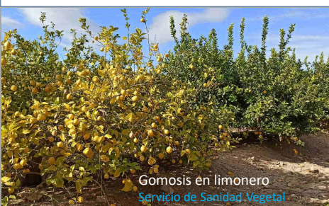
Gomosis en limonero Servicio de Sanidad Vegetal

Este hongo destruye los vasos conductores de sabia de la planta, provocando deshidratación severa y una seca rápida de las ramas afectadas. Estos síntomas empiezan en las hojas, que acaban cayendo dejando el peciolo adherido, continuando por brotes y frutos. La infección se inicia en las ramas tiernas, quedando sin hojas pero verdes. En pocos días van secándose dejando una coloración marrón pálida. Estas secas van progresando rápidamente hacia las ramas principales, afectando a todo el árbol hasta su muerte en 1 a 3 años. Internamente, las ramas muestran una coloración anaranjada o asalmonada. Más tarde, produce anillos de color pardo-negruzco en el leño. No debemos confundir estos síntomas con Gomosis, que produce un declive y clorosis progresivo y general del árbol, además de mostrar la típica goma y rajado en corteza