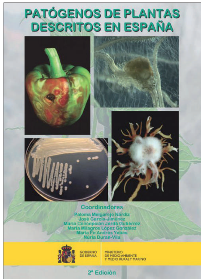
Figura 2. Portada de la segunda edición del Catálogo de patógenos de plantas descritos en España. El libro incluye la descripción de los patógenos, huéspedes afectados, enfermedades que causan y su distribución geográfica, sustentándose en referencias suficientemente acreditadas. El libro ha sido elaborado por especialistas de la Sociedad Española de Fitopatología y editado por esta Sociedad en colaboración con el Ministerio de Medio Ambiente y Medio Rural y Marino.

de los diversos patógenos vegetales, la PCR ha revolucionado las técnicas de detección y diagnóstico, posibilitando la identificación rápida y precisa de los agentes patógenos (HENSON y FRENCH, 1993). Actualmente existen diversas variantes de la PCR, que permiten aumentar la sensibilidad y especificidad, y un buen número de protocolos para la detección de diversos agentes patógenos (p. ej., LÓPEZ et al. , 2003; DE BOER y LÓPEZ, 2012).