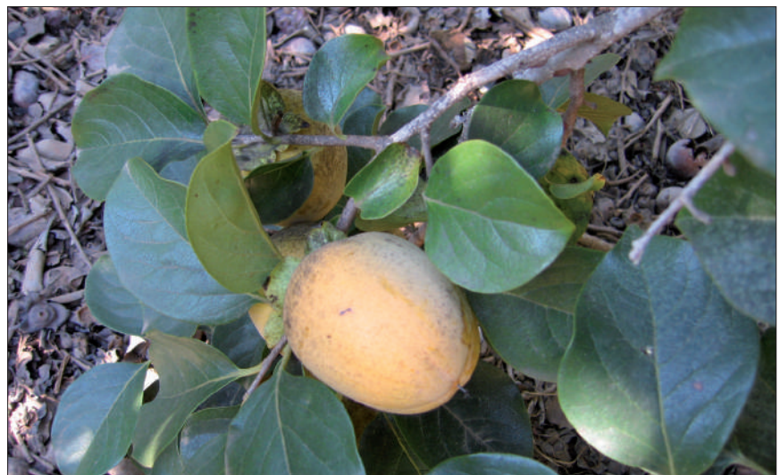
Presencia de negrilla por la acción de cotonet.

En cuanto a las plagas que afectan al cultivo del caqui, destaca en primer lugar, por volumen de da-