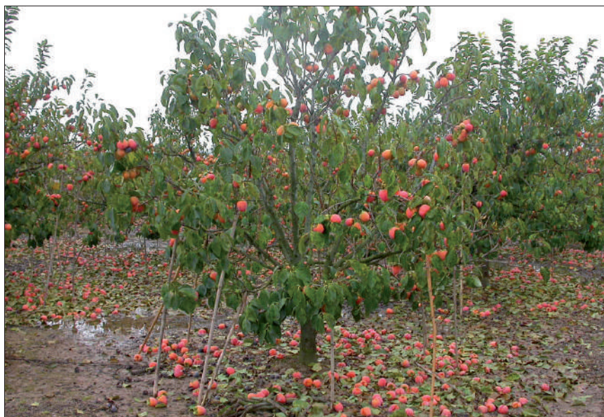
Maduración anticipada y caída de frutos en árboles afectados por Mycosphaerella nawae .

hace algunos años, pero con la diferencia de que en esas zonas sí que hay productos fitosanitarios autorizados.