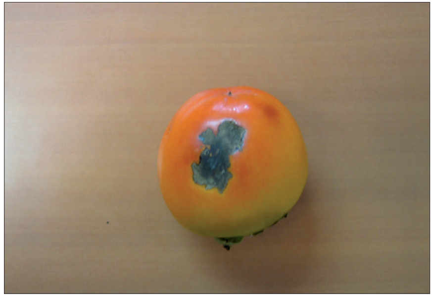
Síntomas de Cryptobables gnidiella .

También la barreneta, Cryptobables gnidiella Mill, está aumentando su problemática, aunque no llega a tener incidencia económica importante. Es un lepidóptero que se refugia en el extremo inferior del fruto bajo los pétalos de la flor que no han caído, alimentándose de la corteza del mismo y depreciándolo comercialmente. El único producto autorizado para esta plaga es Bacillus thuringiensis , aunque normalmente los daños producidos no llegan a justificar en la mayoría de casos los tratamientos.