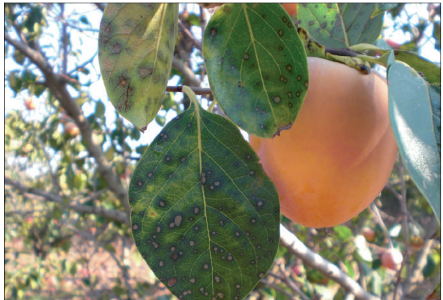
Síntomas de la mancha foliar causada por Mycosphaerella nawae en caqui cv. Rojo Brillante.