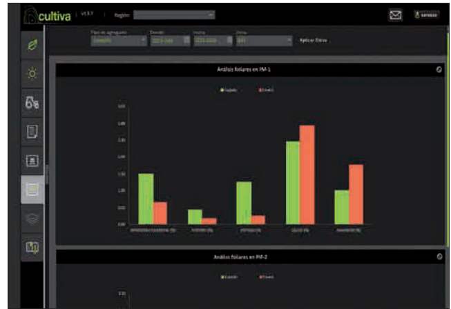
Imágenes 2 y 3. Muestra de las diferentes versiones multidispositivo del software desarrollado por CULTIVA Decisiones y detalle de gráficas generadas por el programa para la consulta del viticultor.

o humedad con diferentes resoluciones y periodicidades, pudiendo ofrecer, por ejemplo, imágenes gratuitas de satélite con una precisión de 10 metros y periodicidad semanal.