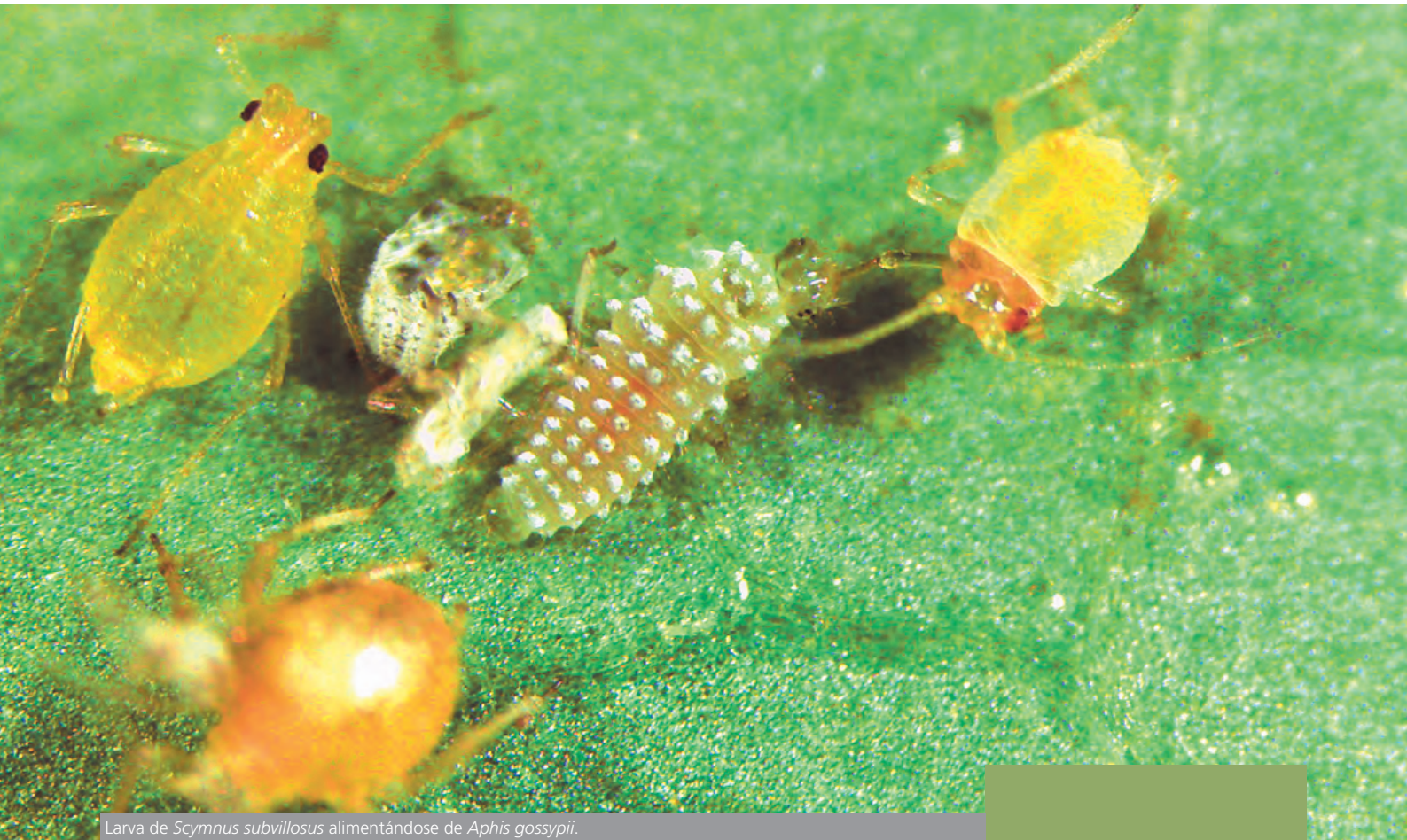
Larva de Scymnus subvillosus alimentándose de Aphis gossypii .