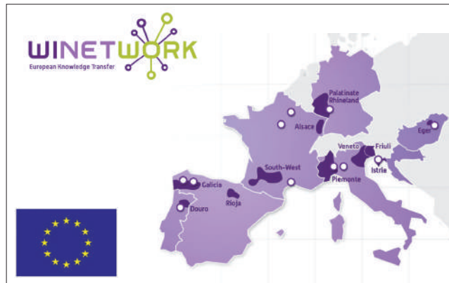
Mapa de implantación de Winetwork en Europa.

Desarrollar un ecosistema para lo co-creación de conocimiento a escala europea. El proyecto WINETWORK desarrollará una metodología