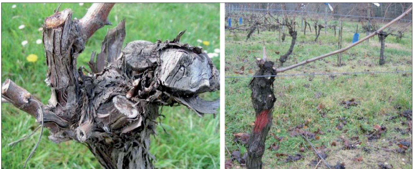
Figura 3. Ejemplos de cepas con importantes heridas de poda en troco y parte superior del mismo, a causa de una poda excesiva.

Después de plantar, hay también muchas decisiones culturales que pueden promover un rápido desarrollo de parásitos y necrosis. La importancia del modo de conducción o del sistema de poda ya se ha mencionado en repetidas ocasiones