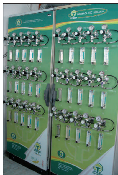
Foto 4. Sistema de mezcla de gases para la aplicación de choques gaseosos.

calculó usando los parámetros de Hunter L , a , b , y la firmeza se determinó como la máxima fuerza en newtons (N) requerida para penetrar en la pulpa del fruto tras pelar la piel de la zona ecuatorial. El índice de madurez (IM) se calculó como CSS/AT .