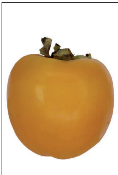
Foto 1. Caqui 'Rojo Brillante' en madurez comercial.

Un lote de fruta no inoculada se trató durante 48 h a 20°C o 35°C con aire (control), 95% CO_2 o la mezcla 30% O_2 + 70% CO_2 y se almacenó a 1°C y 90% HR durante 12 semanas. En el momento de cosecha (calidad inicial) y tras las 12 semanas de almacenamiento en frío se evaluaron los siguientes parámetros físico-químicos de calidad: pérdida de peso, firmeza (Instron Universal Machine, Modelo 3343, Instron), color externo (Minolta CR-400 chroma meter, Konica Minolta Sensing, Inc.), contenido en sólidos solubles (CSS) (Atago Pocket refractometer, Atago Co. Ltd.) y acidez titulable (AT) (Titration Excellence T50, Mettler Toledo). El color externo, expresado como índice de color (IC), se