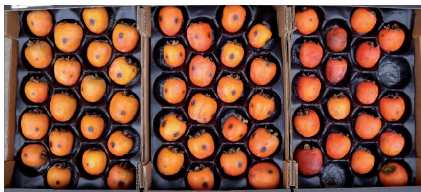
Foto 5. Ejemplo del efecto de choques gaseosos en el desarrollo de la mancha negra en caquis inoculados artificialmente.

ABSTRACT: 'Rojo Brillante' persimmons were artificially inoculated with Alternaria alternata and exposed 24 h later for 48 h at 20 or 35°C and 90% RH to: air (control), 95% CO 2 or 30% O 2 + 70% CO 2 . Treated fruit were either incubated at 20°C and 90% RH for 10 days or cold-stored at 1°C and 90% RH for 82 days, and black spot development was periodically determined. The effect of gaseous