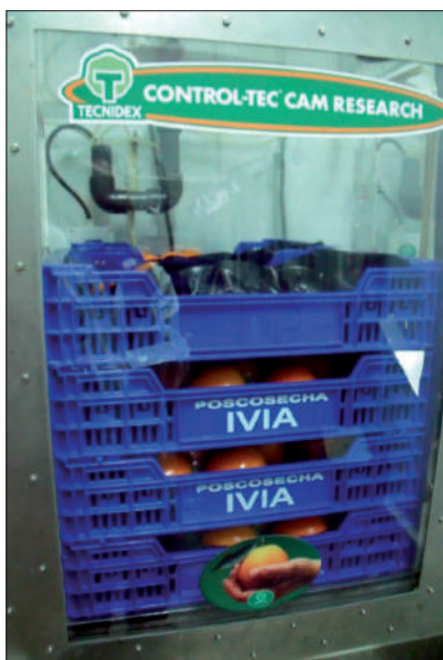
Foto 3. Cabinas de atmósfera controlada utilizadas para la aplicación de choques gaseosos.