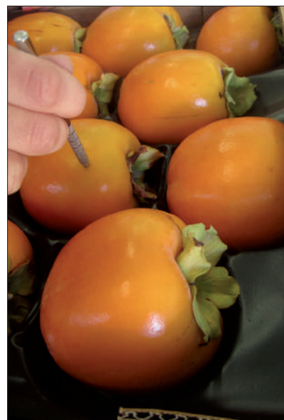
Foto 2. Inoculación de caquis con una suspensión de esporas de Alternaria alternata .