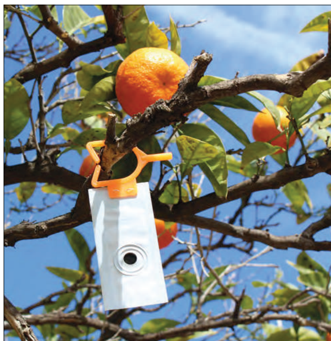
CheckMate® CRS es la solución de confusión sexual para el control del piojo rojo de California de Suterra.