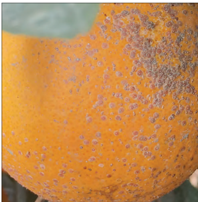
El piojo rojo de California es una de las preocupaciones principales de la citricultura en muchas zonas del mundo.

El empleo de esta técnica está permitiendo la reducción progresiva de la dependencia del control basado en insecticidas y el consecuente restablecimiento de la fauna auxiliar, ayudando a la implementación de sistemas de gestión de plagas más respetuosas con el medio ambiente. Muestra además una sinergia con la acción de Aphytis sp., potenciando la eficacia de las sueltas aumentativas de este parasitoide. Finalmente, también está ayudando al manejo de las crecientes resistencias del piojo rojo de California frente al uso masivo de ciertos insecticidas, como los derivados del ácido tetrámico.