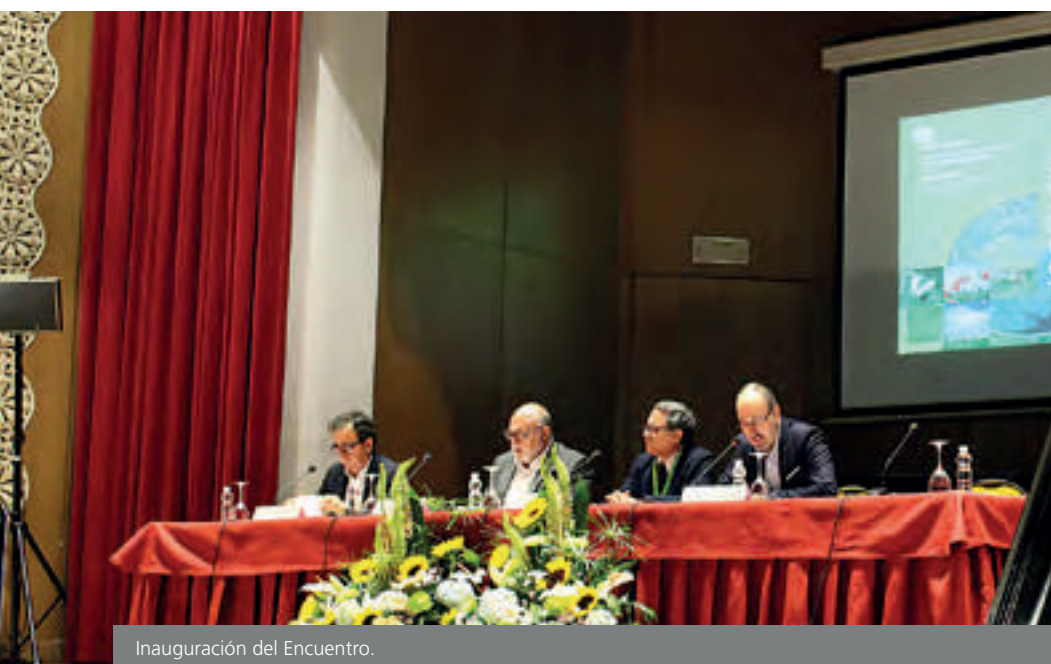
Inauguración del Encuentro.

Ante este panorama, agravado por la globalización, que ha disparado el comercio de plantas y semillas y con él la expansión de enfermedades vegetales, los expertos plantearon la necesidad de potenciar las medidas preventivas, de controlar los movimientos de material vegetal, implantar medidas de erradicación efectivas y desarrollar programas de investigación.