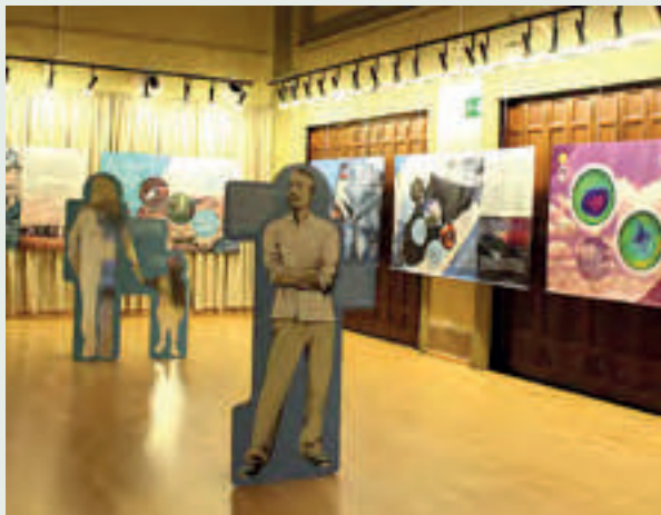
Antropoceno: la era del cambio global.