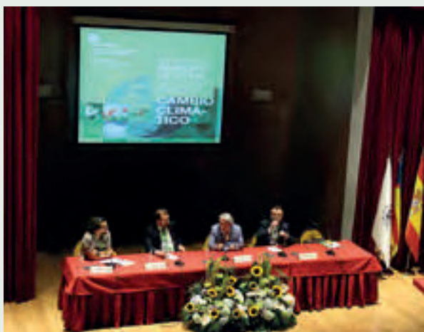
Mesa redonda sobre plagas emergentes.