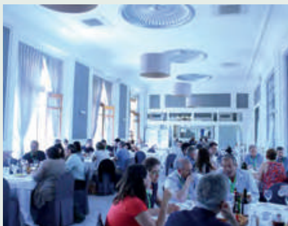
Restaurante del Ateneo.