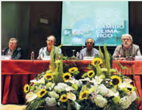
Mesa redonda sobre cambio climático y enfermedades.