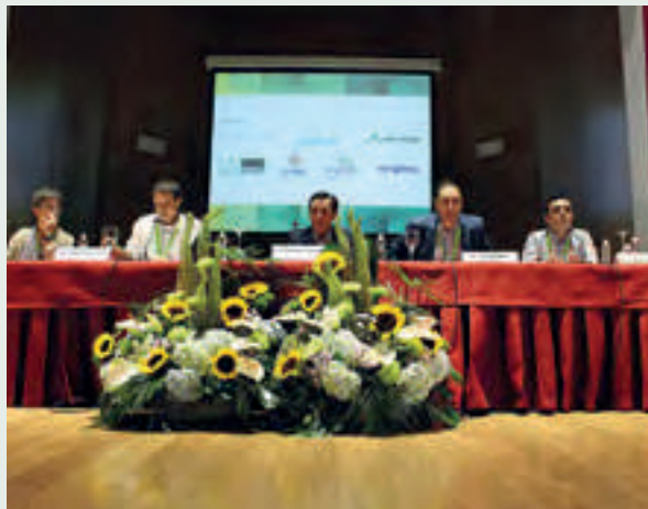
Mesa redonda sobre comercialización de medios de defensa y producción.