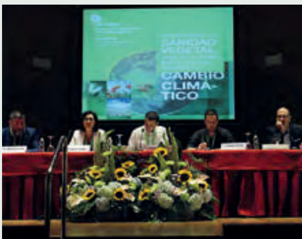
Mesa redonda sobre uso sostenible de productos fitosanitarios.

utilización de este tipo de técnicas. En otras partes del mundo, como América del Sur y Australia, son muy utilizadas y están perfectamente establecidas”.