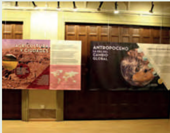
Paneles de la exposición.