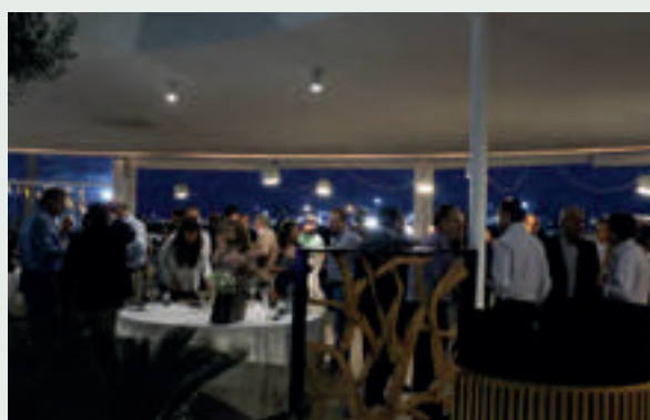
Algunos invitados, en el Marina Beach Club.