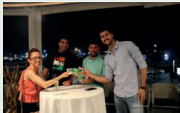
Repartiendo el libro de relatos finalistas de los Premios 30 Aniversario Phytoma.