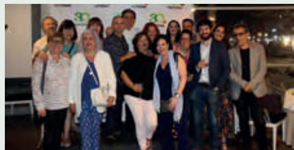
Algunos miembros del equipo de Phytoma, desde su nacimiento hasta la actualidad.

El evento finalizó con la proyección de un vídeo conmemorativo del 30 Aniversario de Phytoma, en el que han participado con sus testimonios una treintena de profesionales vinculados a Phytoma, muchos de los cuales estaban presentes.