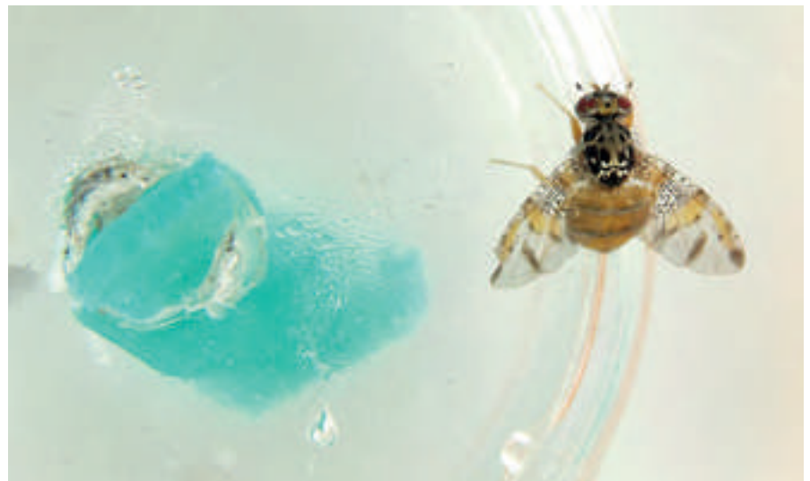
Ceratitís capitata sobre placa de pruebas.

En estudios anteriores pudimos asociar la resistencia a lambda-cihalotrina con la sobreexpresión del gen CYP6A51 en la cepa resistente W-1Kλ (Arouri y col., 2015). Sin embargo, recientemente hemos podido determinar