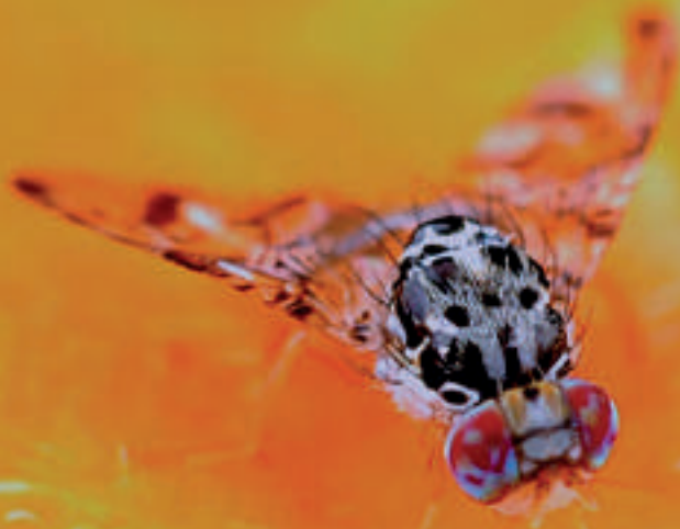
Adulto de Ceratitís capitata .