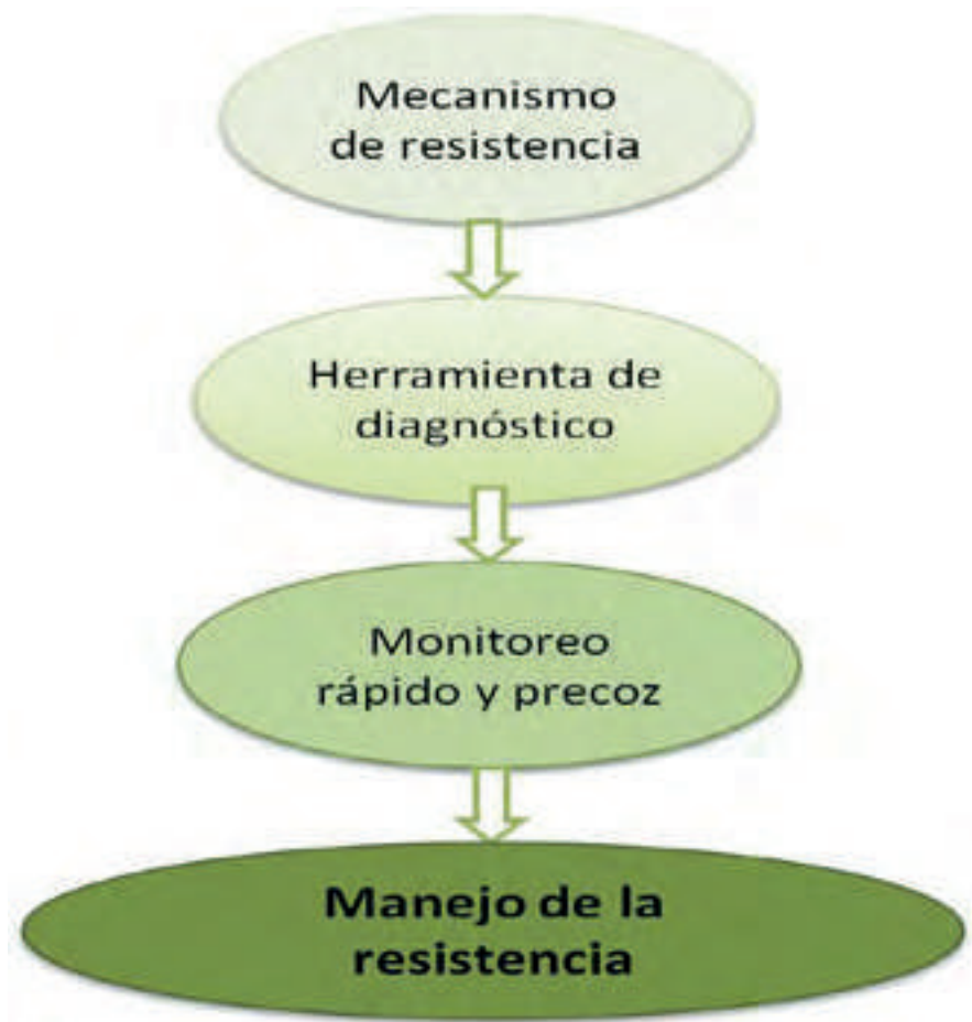
Figura 1. Esquema para el manejo de la resistencia de Ceratitis capitata a insecticidas.

La aparición de resistencia en poblaciones de campo se detectó por primera vez en España frente a malatión en 2004-2005 (Magaña y col., 2007), asociada al uso intensivo que se hacía de este producto, y poste-