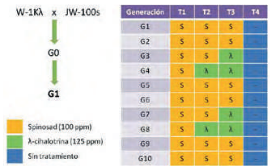
Figura 3. Simulación en laboratorio de cuatro estrategias (T1-T4) de manejo de la resistencia de Ceratitís capitata .

u otros insecticidas con los que presente resistencia cruzada, como fosmet (Couso-Ferrer y col., 2011), se utilizaran sin una estrategia apropiada de manejo. También se han diseñado marcadores para la detección de las mutaciones asociadas a la resistencia a spinosad y, hasta la fecha, ninguna de ellas ha sido hallada en las poblaciones de campo analizadas (Ureña y col., manuscrito enviado para su publicación).